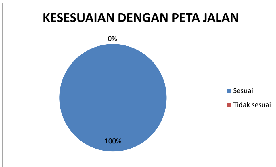
Gambar 1. Kesesuaian Pengabdian Kepada Masyarakat Dengan Peta Jalan

Monitoring dan evaluasi kegiatan pengabdian kepada masyarakat tahun ajaran 2021/2022 meliputi kesesuaian kegiatan pengabdian kepada masyarakat dengan peta jalan, keterlibatan mahasiswa dalam kegiatan pengabdian kepada masyarakat, dan kontribusi keilmuan dalam kegiatan pengabdian kepada masyarakat.