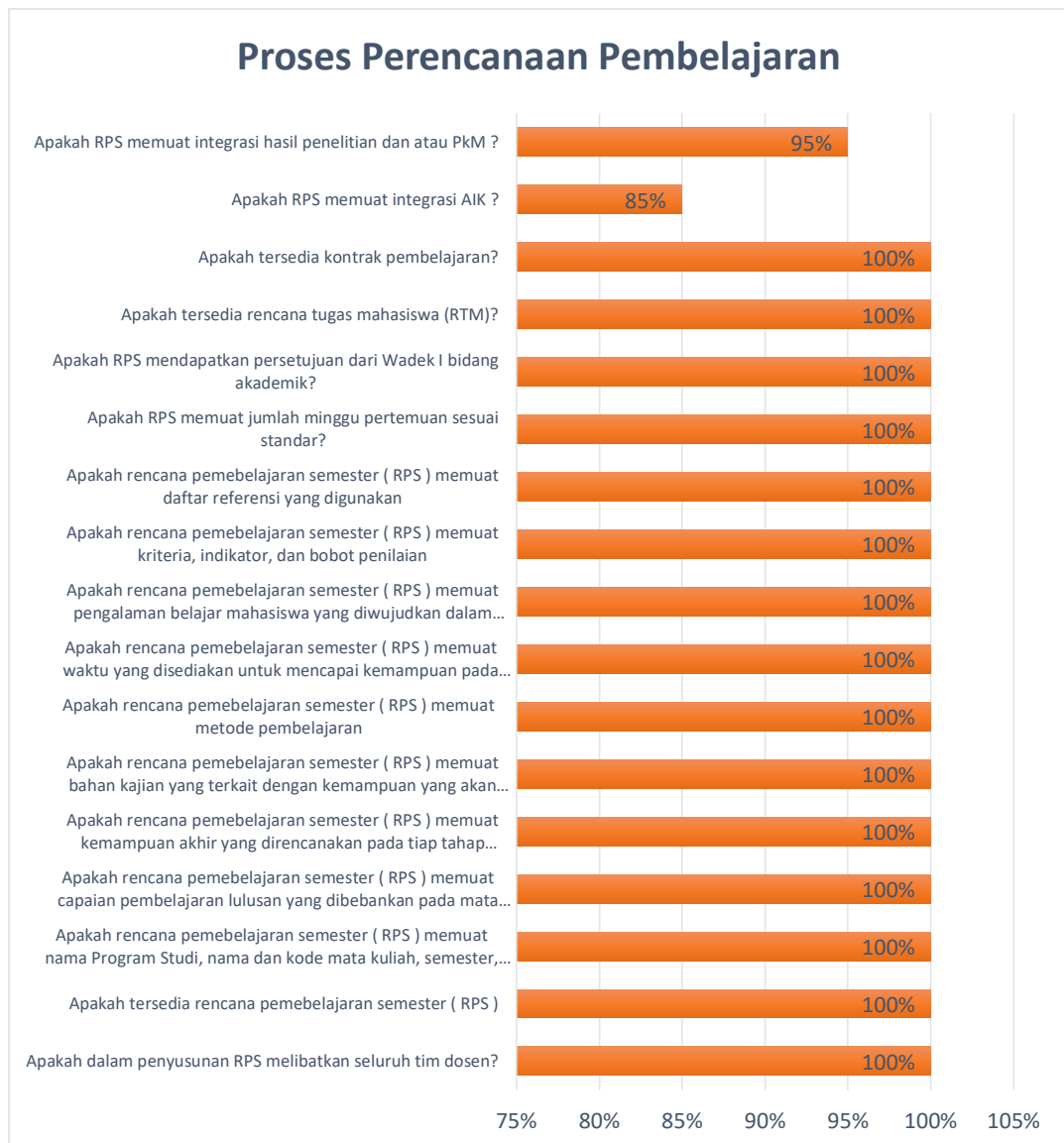
Gambar 2.1. Perencanaan Pembelajaran Ganjil 2023/2024